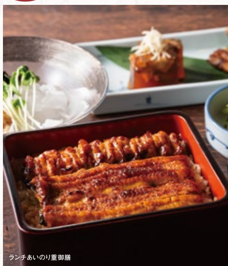
ランチあいのり重御膳