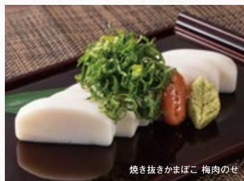
焼き抜きかまぼこ 梅肉のせ