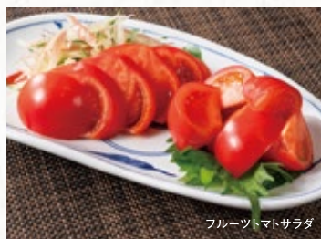
フルーツマトサラダ