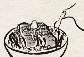
③ 薬味をのせたものに 出汁をかけ、出汁茶漬けに

※ご飯は100円で大盛りに変更ができます。 ※仕入れ状況により鰻の形が異なりますが、量目は変わりません。 ※原材料の一部に小麦が含まれております。