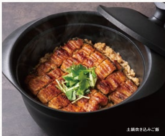
土鍋炊き込みご飯