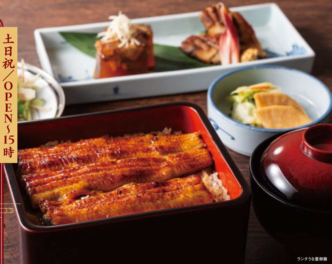
ランチうな重御膳