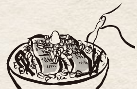
③薬味をのせたものに 出汁をかけ、出汁茶漬けに

※ご飯は100円で大盛りに変更ができます。 ※仕入れ状況により鰻の形が異なりますが、量目は変わりません。 ※原材料の一部に小麦が含まれております。