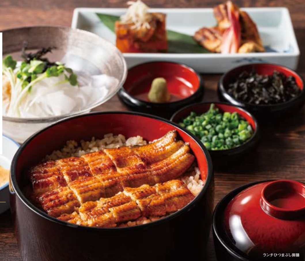
ランチひつまぶし御膳