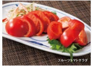
フルーツマトサラダ