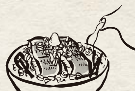
③ 薬味をのせたものに 出汁をかけ、出汁茶漬けに

※ご飯は100円で大盛りに変更ができます。 ※プラス200円で肝吸いに変更ができます。 ※仕入れ状況により鰻の形が異なりますが、量目は変わりません。 ※原材料の一部に小麦・卵が含まれております。