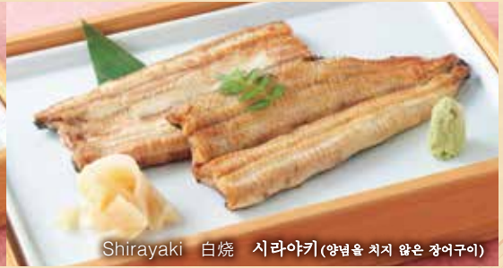
Shirayaki 白烧 시라야키(양념을 치지 않은 장어구이)

We process eels carefully, but sometimes they have tiny bones. We appreciate your understanding. 我们在烹制鳗鱼的时候非常谨慎,但偶尔也会有鱼骨混入其中。敬情见谅。 장어를 정성껏 손질해서 제공드리고 있습니다만, 작은 뼈가 남아있을 수 있습니다. 미리 양해 바라겠습니다.