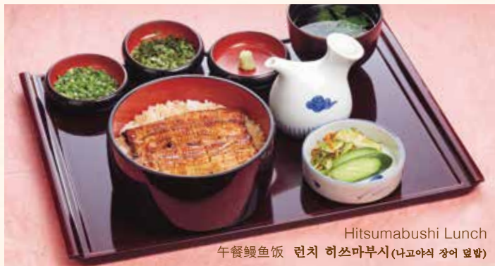
Hitsumabushi Lunch 午餐鰻魚飯 런치 히쓰마부시(나고야식 장어 덮밥)

配有腌制蔬菜、鰻魚肝汤以及调料(海苔、葱、芥末)。절임 채소, 장어 간국, 그리고 양념(김, 파, 고추냉이)이 포함됩니다.