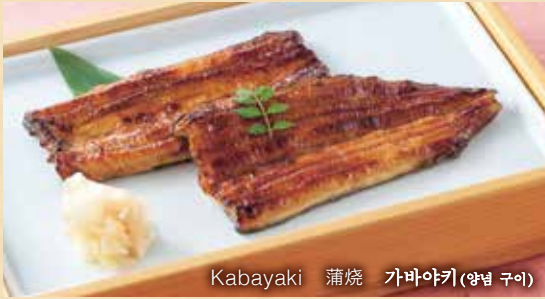
Kabayaki 蒲烧 가바야키(양념 구이)