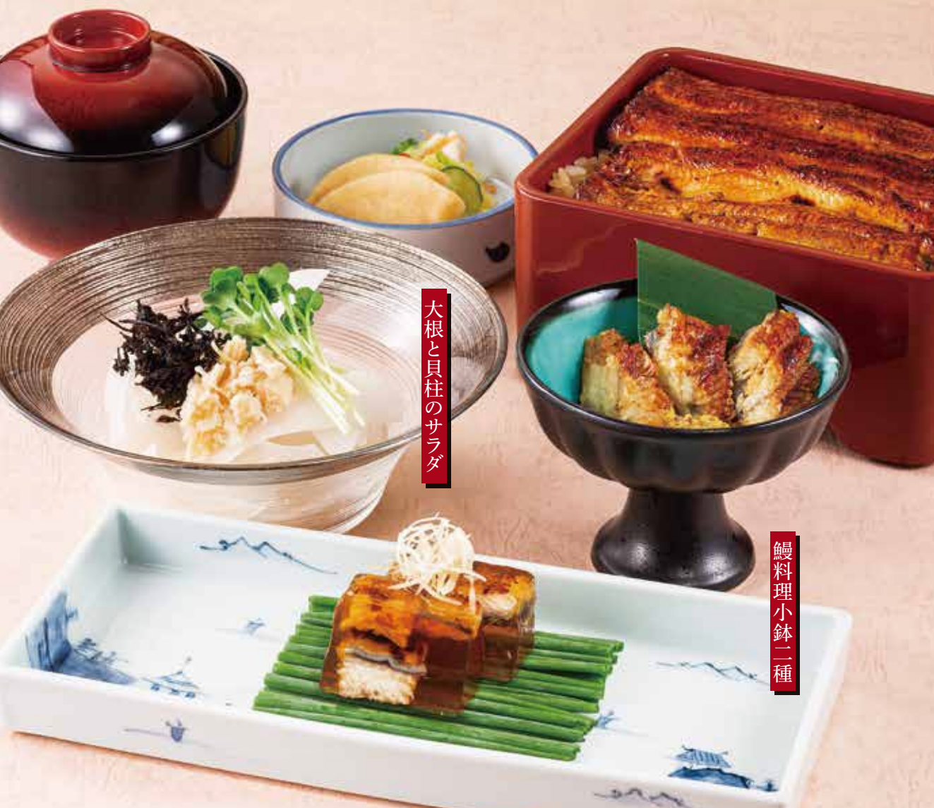
大根と貝柱のサラダ