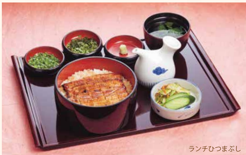
ランチひつまぶし