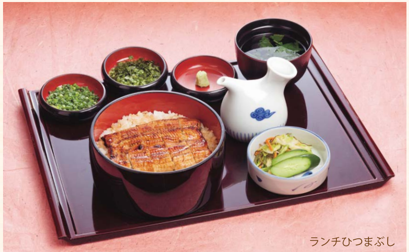
ランチひつまぶし