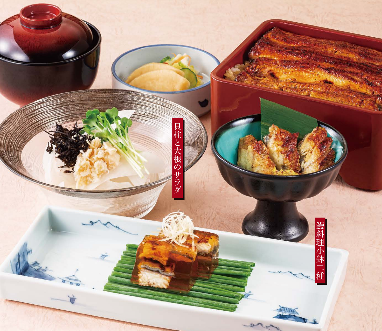
貝柱と大根のサラダ