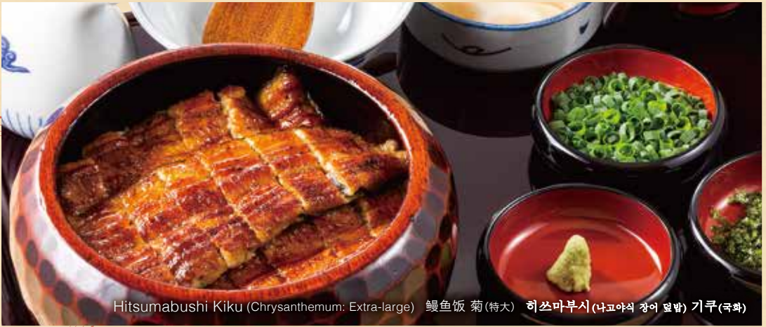
Hitsumabushi Kiku (Chrysanthemum: Extra-large) 鰻鱼饭 菊(特大) 히쓰마부시 (나고야식 장어 덮밥) 기쿠(국화)