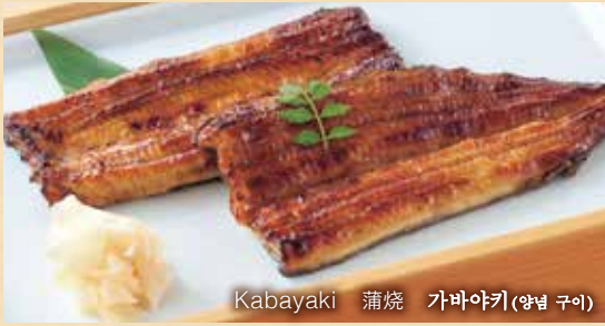
Kabayaki 蒲烧 가바야키(양념 구이)