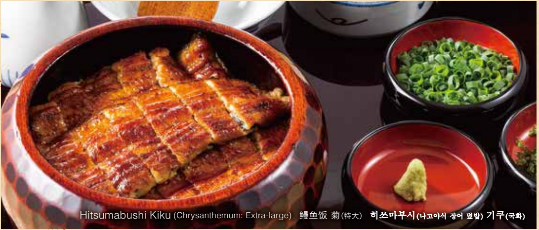
Hitsumabushi Kiku (Chrysanthemum: Extra-large) 鰻鱼饭 菊(特大) 히쓰마부시(나고야식 장어 덮밥) 기쿠(국화)