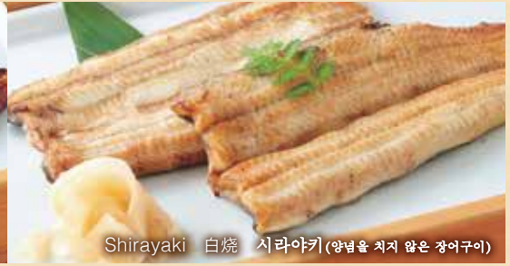
Shirayaki 白烧 시라야키(양념을 치지 않은 장어구이)

We process eels carefully, but sometimes they have tiny bones. We appreciate your understanding. 我们在烹制鳗鱼的时候非常谨慎,但偶尔也会有鱼骨混入其中。敬情见谅。